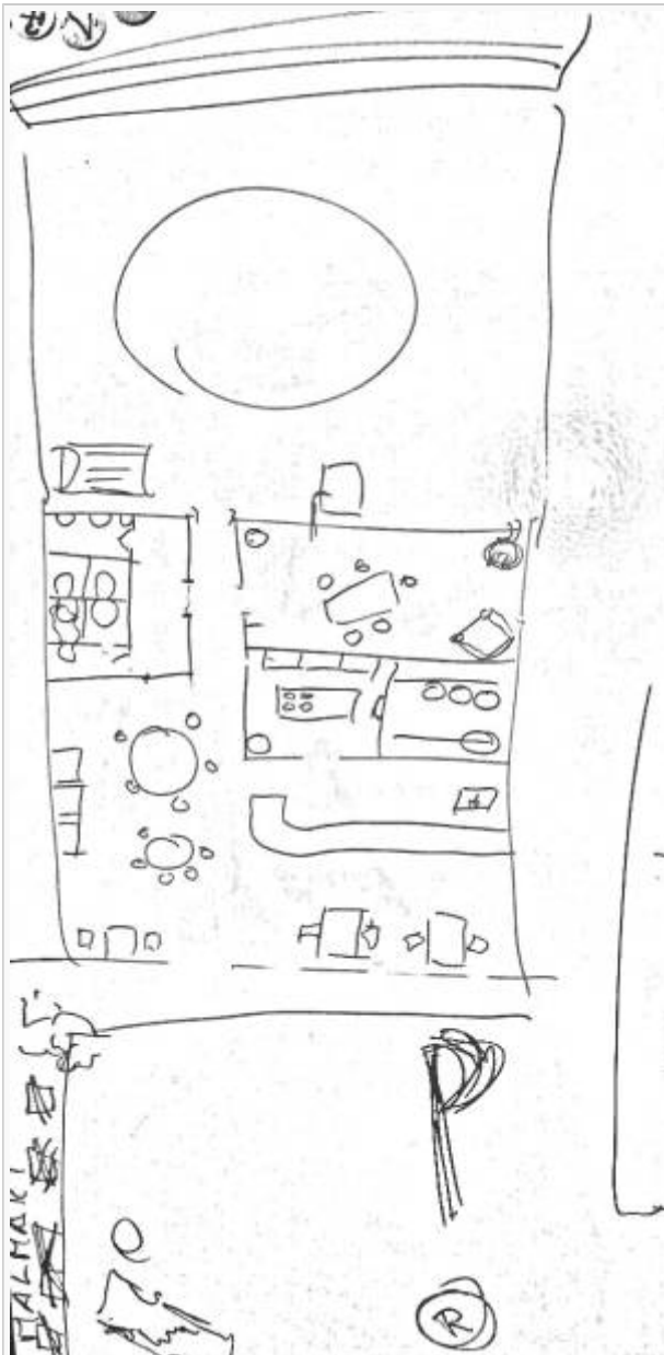
Markos Kneipe: Das Loch

Im Osten Duisburgs, nahe Moers liegt Das Loch. Seinem Namen verdankt es dem klaffenden Loch im Hinterhof - ein eingestürzter Minenschacht. Der Wirt heißt Marco. Einige nette Menschen* halfen ihm bei einem Schutzgeldproblem. Er scheint Verbindungen zu den Abu Leil Riders und anderen fragwürdigen Gestalten zu haben.